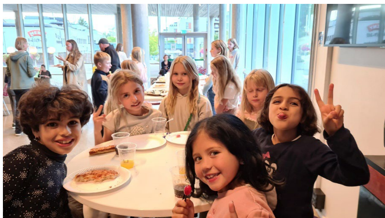
16. september 2022: Verdens aller første, men ikke siste, pizza- og filmkveld for barna i Nesodden karateklubb