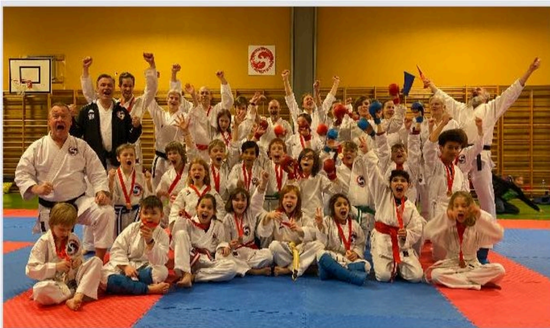
Oppmøterekord en fredagskveld, 18. mars 2022. Det hjelper med medaljer!

I tillegg til de ordinære treningstimene kommer seminarer, Håøya, søndagstreninger og klubbmesterskap.