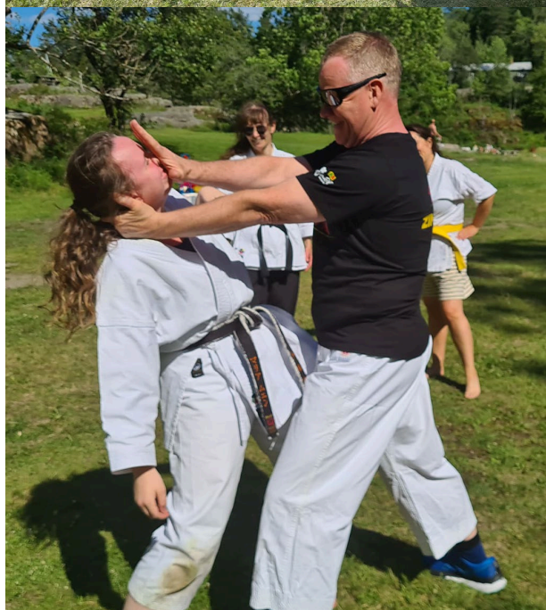
16. til 19. juni: Håøya for første gang på 2 år! Kun to dager denne gangen, siden fredagen regnet bort (Oslo kampsportklubb lot seg ikke skremme av litt uvær og ble alle tre dagene)