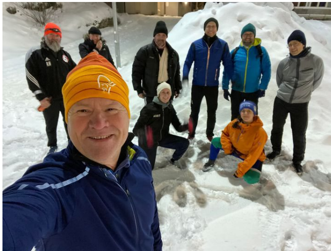
Utetrening i januar 2022

Siden året i styreammenheng går fra årsmøte til årsmøte, vil denne årsmelingen også ha med elementer fra året vi nå er inne i.